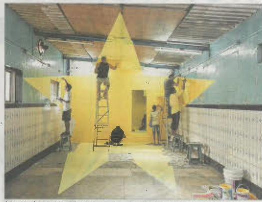
Aujourd'hui à 20h30, "Mumbai 2014, Georges Rousse", un film de Sandra Calligaro et Julie Rousse.

«En faisant entendre leurs voix, cet enthousiasme absolu qu'ils avaient à découvrir la peinture et les techniques et les petites perles qu'ils nous ont dites. Comme celle-ci venu d'un tout petit : "En mélangeant les couleurs j'ai compris que si on se mélange tout ensemble, cela peut produire quelque chose de nouveau." Ils prennent tout ce qu'on leur offre, avec joie, curiosité et un plaisir d'apprendre inouï ! Leur travail autour de l'œuvre est l'axe principal du film. On voulait montrer quelque chose de très sensible. Il nous fallait