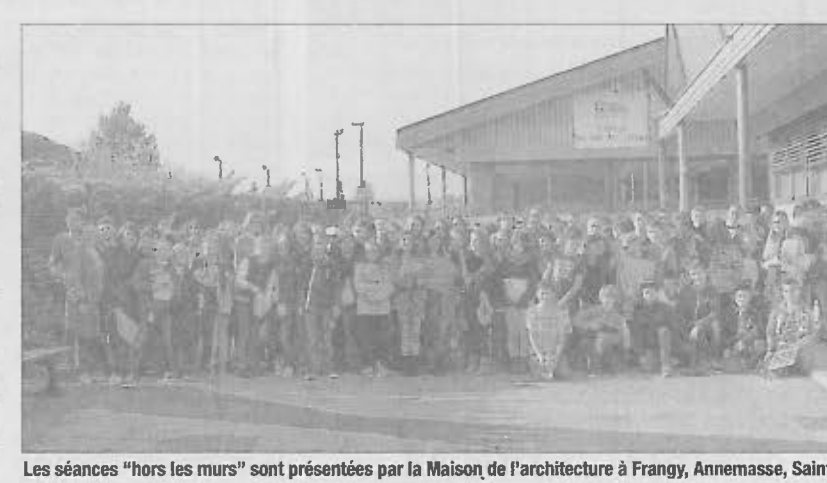
Les séances "hors les murs" sont présentées par la Maison de l'architecture à Frangy, Annemasse, Saint-Julien-en-Genevois et Annecy.