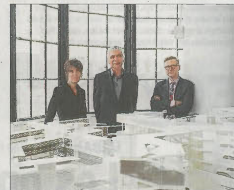
À voir à 19h30, "Diller Scofidio + Renfro". La célèbre agence enthousiasme les New-Yorkais avec une approche décloisonnée.

"La ville autrement" explore des voies vers la ville durable. Ces approches alternatives viennent se confron-