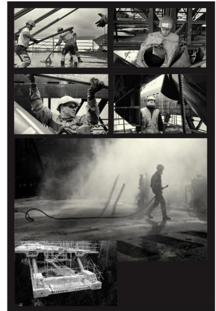
pour la 1ère année, 3 lieux et 6 séances de projections «Hors les Murs»