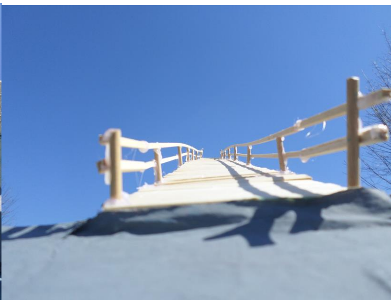
Les trois maquettes réalisées ont fait parties de l'exposition organisée par le Conseil Général de Haute-Savoie entre mai 2015 et octobre 2015 au Château de Clermont s'intitulant : Mémoires de ponts » sur les ponts de Haute-Savoie.