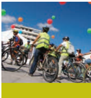
Randonnée vélo.

► Voir aussi Une autre randonnée vélo est programmée dans le sens Meythet – Anney, voir page 17