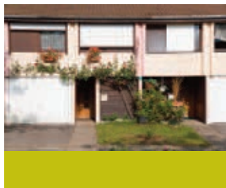
Seynod, impasse des Sureaux, 1975, Jacques Lévy, architecte.