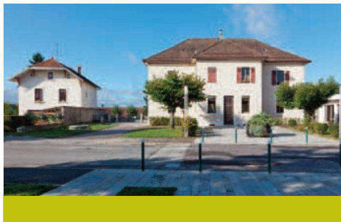
Poisy, ancienne école.

rdv rue des Grandes Teppes à côté du Centre d'animation (CAPS) info@cie-calabash.com 09 54 43 86 00