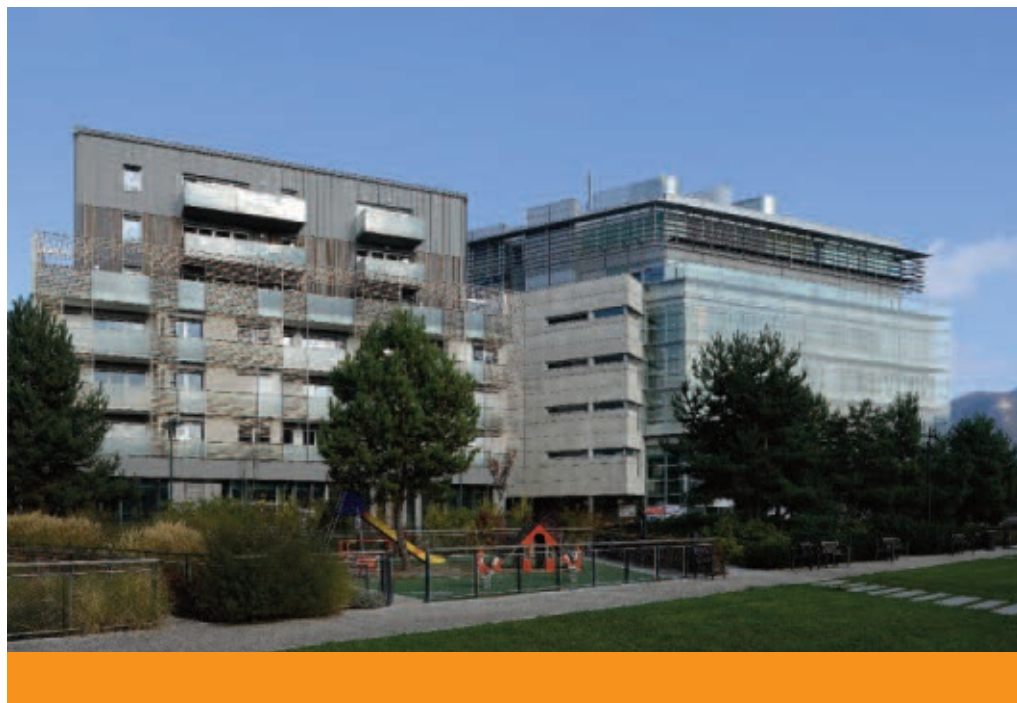
Annecy, quartier Galbert, à gauche immeuble des archives municipales, livraison 2013, Brière & Brière architectes.

Venez découvrir la salle d'exposition et les sous-sols du nouveau bâtiment.