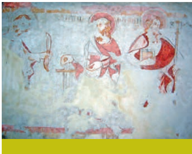
Anney-le-Vieux, clocher roman, peintures murales, 15 e siècle. Cliché Ville d'Anney-le-Vieux.