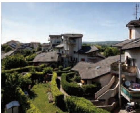
Cran-Gevrier, Le Moulin de la galette, 1982, Richard Plattier, architecte.