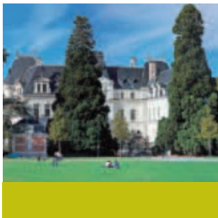
Anney, Préfecture de Haute-Savoie.