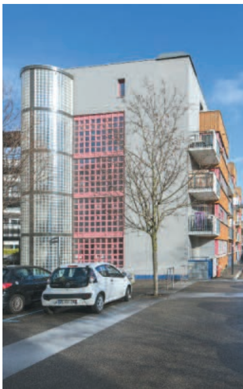
Cran-Gevrier, rue du Kiosque, architecte Jean-François Wolf, 1992.

rdv avec votre appareil photo devant l'entrée de l'École supérieure d'art de l'agglomération d'Ancecy, 52 bis, rue des Marquisats à Ancecy / durée 2h