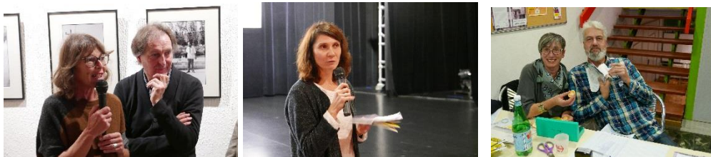
Quelques-uns parmi les membres actifs de la commission cinéma de la ma74

Un des changements dans notre organisation consiste à placer l'assemblée générale en début d'année, afin de rendre compte plus immédiatement des Rencontres de l'année précédente, et de présenter un agenda annuel. Dans ce rapport on trouvera exceptionnellement le récit des deux Rencontres, les 16 e et 17 e .